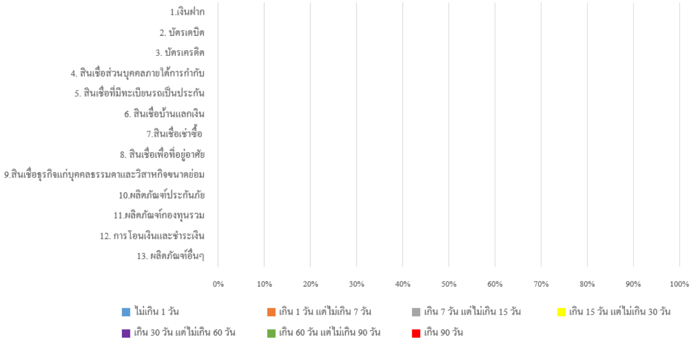
แผนภูมิข้อมูลเรื่องร้องเรียน จำแนกตามระยะเวลายุติเรื่องที่เกิน 15 วัน